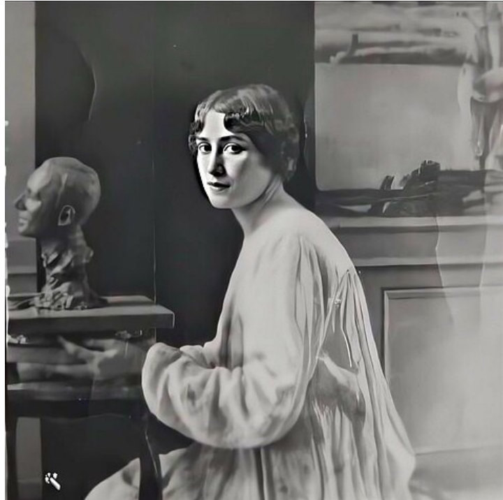
portrait de Louise OCHSÉ dans son atelier sculptant le buste de Maurice RAVEL