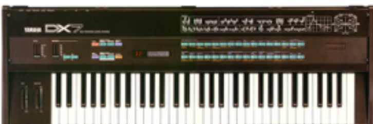
Yamaha Synthétiseur DX7. Emblème des années 80.

Avant même de présenter le thème, Miles joue l'échelle de notes qui servira à ses improvisations et improvise ensuite. Le thème fait alterner quelques envolées de notes et des notes tenues. Le tout se déroule sur des accents blues avec l'apparition fréquente de la blue note , entrecoupé de contre chants de basse et de pads . Miles poursuit son improvisation sur la dernière partie alors que l'on entend le thème à la trompette. C'est un procédé de Rerecording , l'album ayant été enregistré en studio.